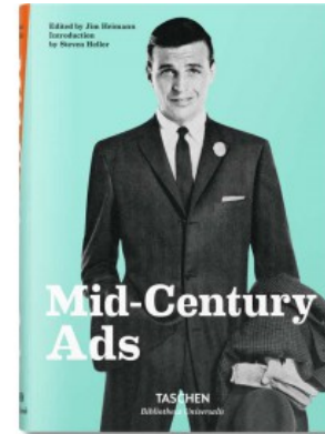
MID-CENTURY ADS (INT) Jim Heimann, Steven Heller 9783836556323 14,99€