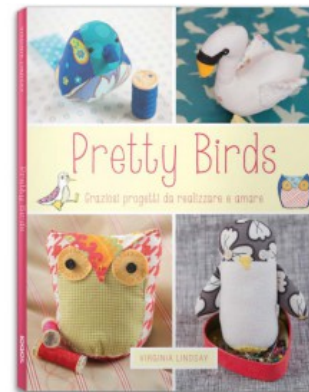
PRETTY BIRDS. GRAZIOSI PROGETTI DA REALIZZARE E AMARE