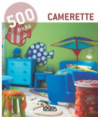
500 TRICKS: CAMERETTE