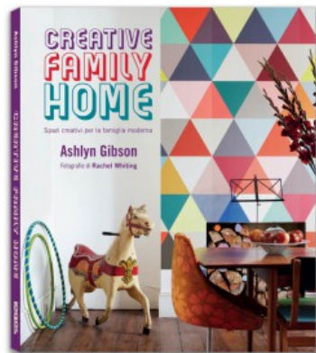
CREATIVE FAMILY HOME

Charlotte Hedeman Guéniau 9788857605913 24,95€