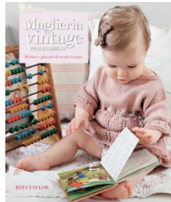
MAGLIERIA VINTAGE PER BAMBINI