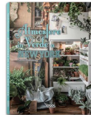
ATMOSFERE IN VERDE A NEW YORK