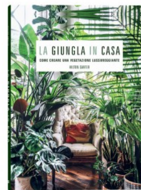
LA GIUNGLA IN CASA