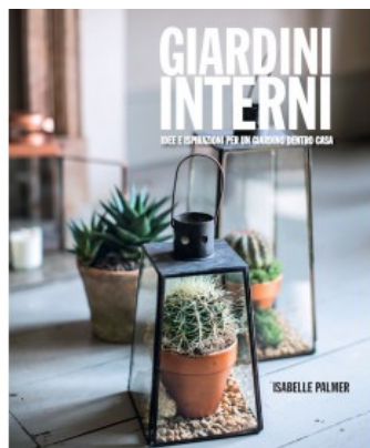
GIARDINI INTERNI. IDEE E ISPIRAZIONI PER UN GIARDINO DENTRO CASA