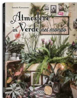
ATMOSFERE IN VERDE NEL MONDO