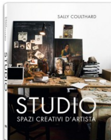
STUDIO. SPAZI CREATIVI D'ARTISTA