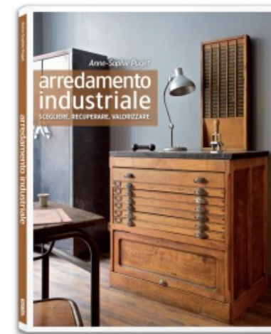
ARREDAMENTO INDUSTRIALE. SCEGLIERE. RECUPERARE. VALORIZZARE.