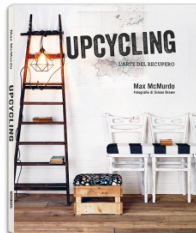
UPCYCLING L'ARTE DEL RECUPERO