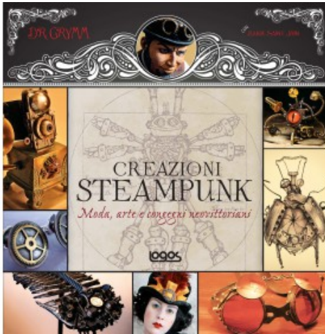
1000 CREAZIONI STEAMPUNK