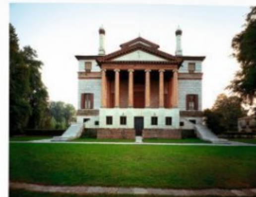
Full view from the north