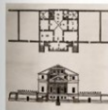
Plan and design for the facade from I Quattro Libri dell'Architettura , 1570, volume 2, page 30

One of Palladio's most beautiful villas can be found on the banks of the Brenta. Its main façade, from which an impressive columned portico projects, is oriented toward the canal. Set on a massive base, it offers visitors who approach the villa from the water, a view of impressive majesty. It is located just outside of the gates of Venice. Originally, it was named after the brothers who had it built, Nicolò and Alvise Foscari but is, however, better known under the name of the small town where it is located Malcontenta.