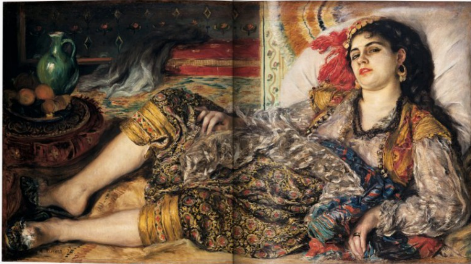
Odalisk (From the Algerians), oil on canvas, 69x112.5 cm Washington (DC), National Gallery of Art, Chester Dale Collection