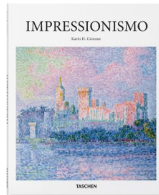
IMPRESSIONISMO (I) #BASICART