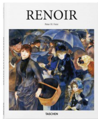
RENOIR (I) #BASICART