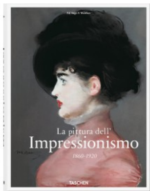
LA PITTURA DELL'IMPRESSIONISMO 1860-1920 - #BIBLIOTHECAUNIVERSALIS