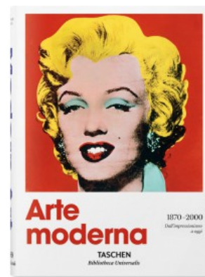
ARTE MODERNA 1870-2000. DALL'IMPRESSIONISMO A OGGI - #BIBLIOTHECAUNIVERSALIS