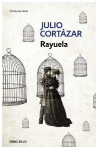
RAYUELA Julio Cortázar 9788466331906 17,50€