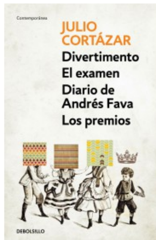
DIVERTIMENTO, EL EXAMEN, DIARIO DE ANDRE FAVA Y LOS PREMIOS Julio Cortázar 9788466337786 19,95€