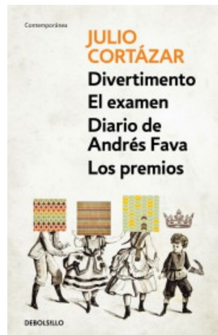
DIVERTIMENTO, EL EXAMEN, DIARIO DE ANDRE FAVA Y LOS PREMIOS Julio Cortázar 9788466337786 19,95€