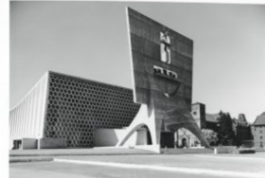
The church and the campania from the northeast