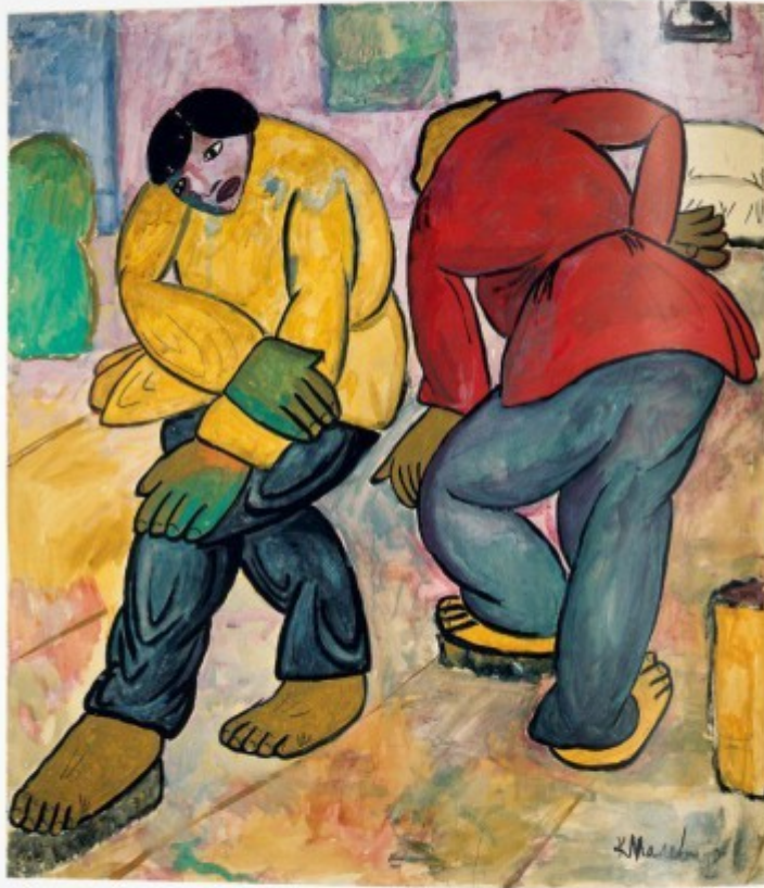
Flas Peñskens, 1911-12 Gouache on paper, 72,7 x 71 cm (28 1/2 x 28 in.) Amsterdam, Stedelijk Museum