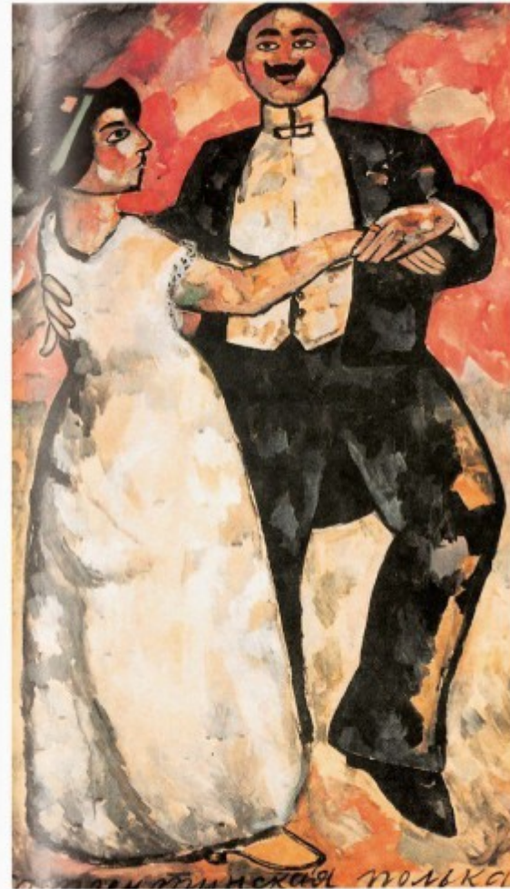
Argentine Polka, 1911 Gouache on paper, 107 x 70,4 cm (42 x 27 3/4 in.) Private collection