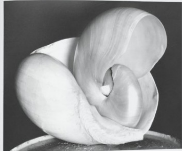
Shell | Mitchell | Capillano 1907