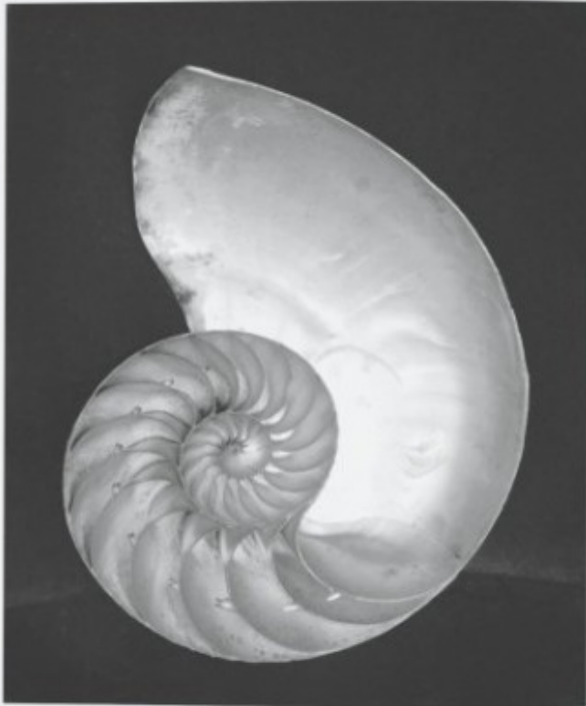
Shell | Mitchell | Capillano 1907