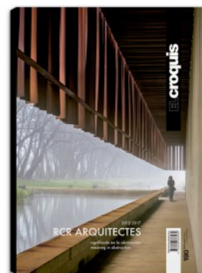
N.190 RCR ARCHITECTS 2012 - 2017