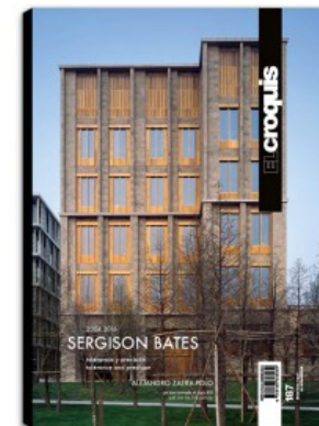
N.187 SERGISON BATES 2004 - 2016