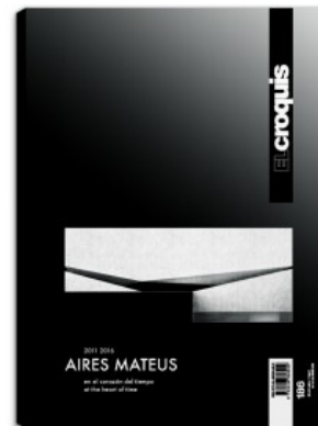
N.186 AIRES MATEUS 2011 - 2016