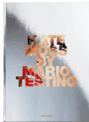
KATE MOSS BY MARIO TESTINO