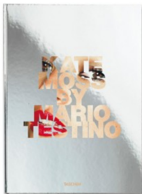
KATE MOSS BY MARIO TESTINO