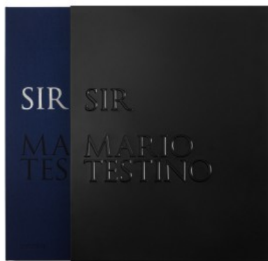
MARIO TESTINO. SIR - EDIZIONE LIMITATA

Mario Testino, Patrick Kinmonth, Pierre Borhan 9783836553452 750,00€