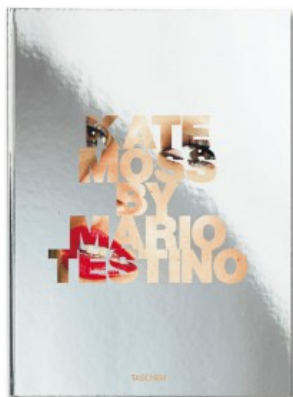
KATE MOSS