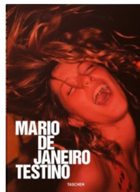
MARIO DE JANEIRO TESTINO (IEP)