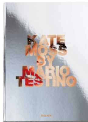
KATE MOSS BY MARIO TESTINO