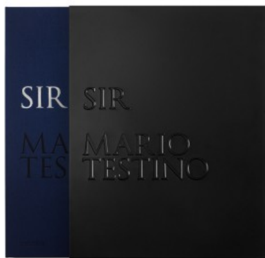
MARIO TESTINO. SIR - EDIZIONE LIMITATA

Mario Testino, Patrick Kinmonth, Pierre Borhan 9783836553452 750,00€