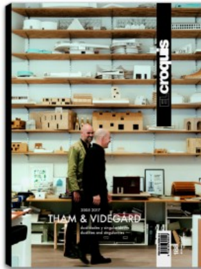
N.188 THAM & VIDEGARD ARKITEKTER 2005 - 2017 AA.VV. 9788488386946 62,00€