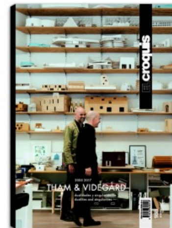
N.188 THAM & VIDEGARD ARKITEKTER 2005 - 2017 AA.VV. 9788488386946 62,00€