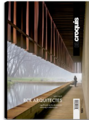
N.190 RCR ARCHITECTS 2012 - 2017 AA.VV. 9788488386960 78,00€