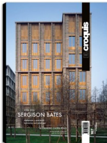
N.187 SERGISON BATES 2004 - 2016 AA.VV. 9788488386939 62,00€