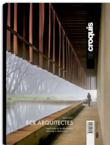
N.190 RCR ARCHITECTS 2012 - 2017 AA.VV. 9788488386960 78,00€