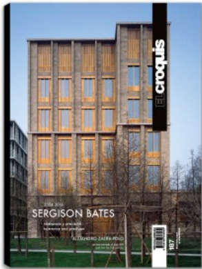
N.187 SERGISON BATES 2004 - 2016 AA.VV. 9788488386939 62,00€