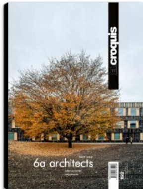
N.192 6A ARCHITECTS A.A.V.V. 9788494775406 64,00€