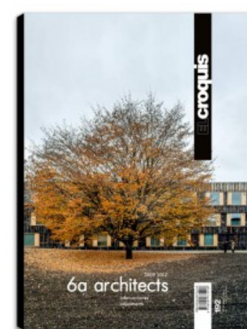
N.192 6A ARCHITECTS A.A.V.V. 9788494775406 64,00€