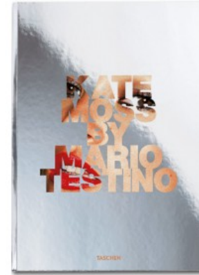
KATE MOSS BY MARIO TESTINO