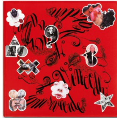
INEZ VAN LAMSWEERDE/VINOODH MATADIN. PRETTY MUCH EVERYTHING - TRADE EDITION

M/M (Paris), Glenn O'Brien 9783836527934 49,99€