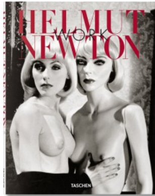
HELMUT NEWTON. WORK (IEP)