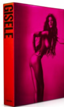
GISELE BÜNDCHEN - TRADE EDITION

Helmut Newton, Philippe Garner 9783822835050 29,99€