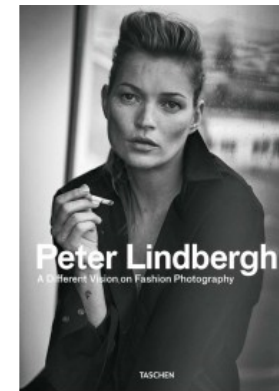
PETER LINDBERGH. A DIFFERENT VISION ON FASHION PHOTOGRAPHY (INT)