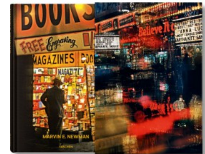
MARVIN E. NEWMAN - EDIZIONE LIMITATA

Peter Lindbergh, Thierry-Maxime Loriot 9783836552820 60,00€