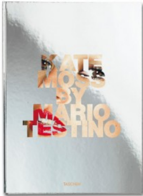
KATE MOSS BY MARIO TESTINO