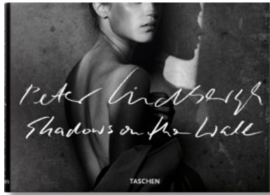
PETER LINDBERGH. SHADOWS ON THE WALL