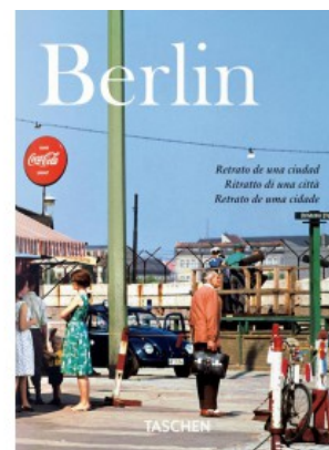
BERLIN. PORTRAIT OF A CITY (IEP)