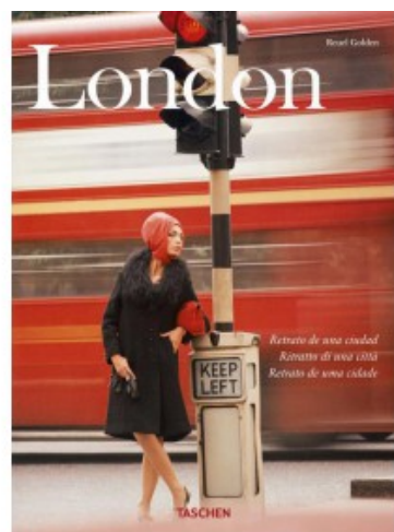
LONDON PORTRAIT OF A CITY (IEP)

Michael Siebler, Norbert Wolf 9783836502184 7,99€