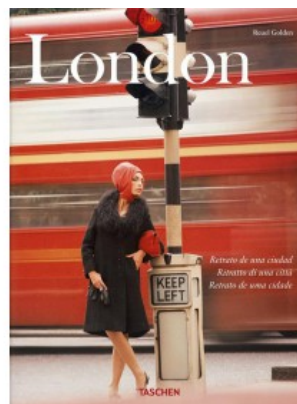
LONDON. PORTRAIT OF A CITY (IEP)

Jean Claude Gautrand 9783836525473 50,00€