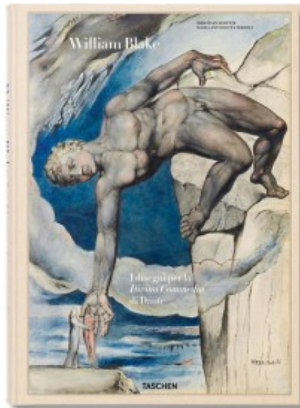
WILLIAM BLAKE. I DISEGNI PER LA DIVINA COMMEDIA DI DANTE - EXTRA LARGE