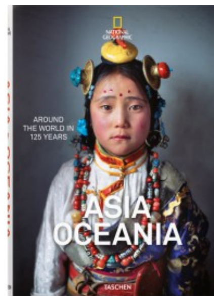
ASIA & OCEANIA - NATIONAL GEOGRAPHIC.