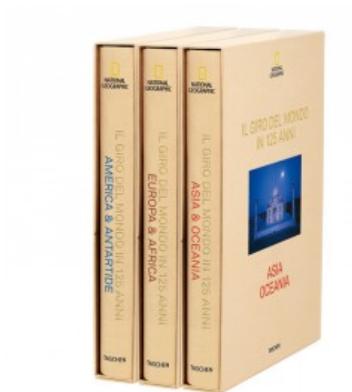
NATIONAL GEOGRAPHIC. IL GIRO DEL MONDO IN 125 ANNI