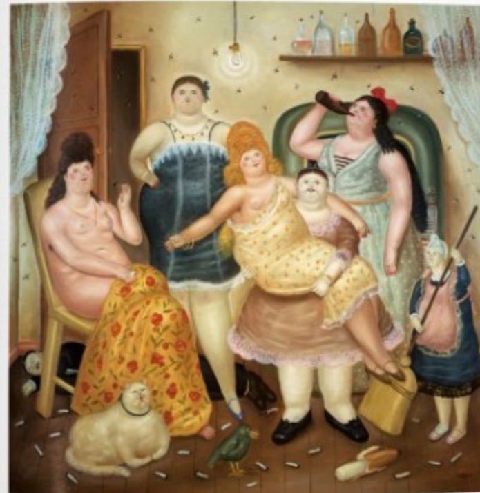
The House of Mariquita, 1970 Oil on canvas, 210 x 174 cm (82 7/8 x 68 1/2 in.) Private collection