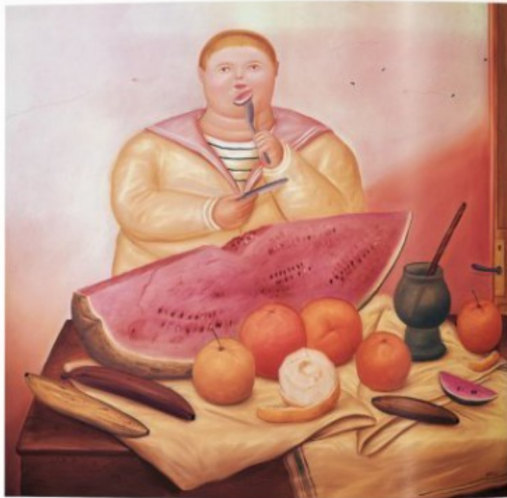
Boy Eating Melon, 1972 Oil on canvas, 184 x 171 cm (74 3/8 x 67 3/8 in.) Private collection