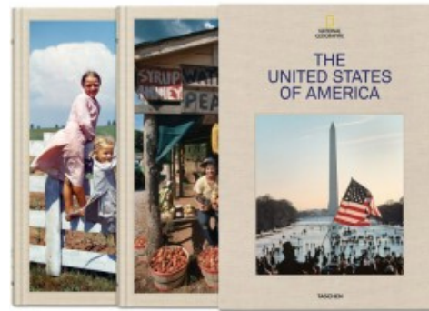
NATIONAL GEOGRAPHIC. THE UNITED STATES OF AMERICA

Jeff Klein, Joe Yogerst, David Walker 9783836561556 275,00€