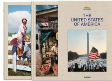
NATIONAL GEOGRAPHIC. THE UNITED STATES OF AMERICA

Jeff Klein, Joe Yogerst, David Walker 9783836561556 275,00€