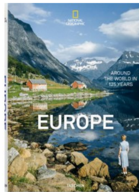
NATIONAL GEOGRAPHIC. AROUND THE WORLD IN 125 YEARS – EUROPE