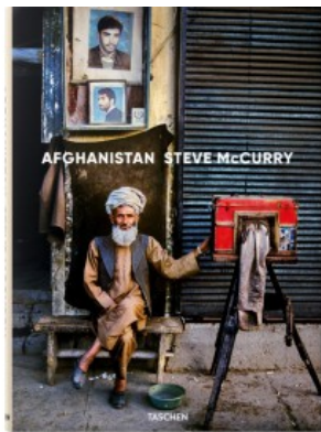
STEVE MCCURRY. AFGHANISTAN