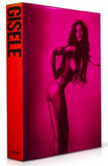
GISELE BÜNDCHEN - TRADE EDITION