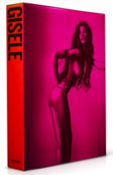
GISELE BÜNDCHEN - TRADE EDITION

Giovanni Bianco, Steven Meisel 9783836542128 60,00€