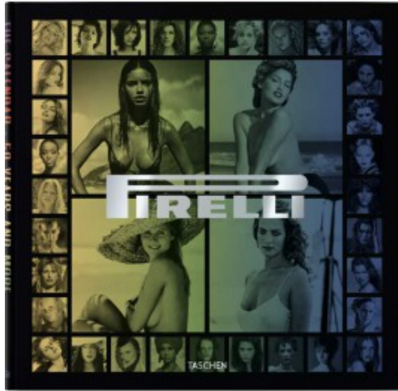
PIRELLI - THE CALENDAR. 50 YEARS AND MORE - TRADE EDITION