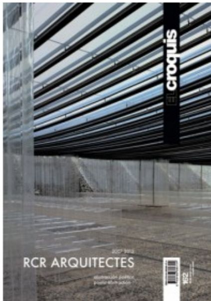
N.162 RCR ARCHITECTS 2007 - 2012