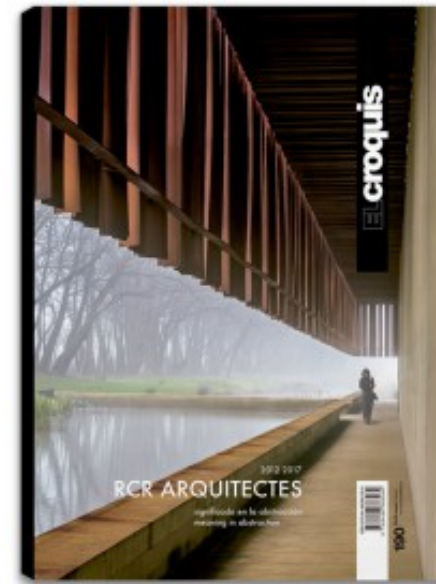
N.190 RCR ARCHITECTS 2012 - 2017