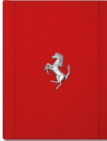
FERRARI - EDIZIONE LIMITATA