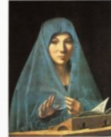
Antonello da Messina The Virgin of the Annunciation , 1474-77 Oil on wood, 45 x 34,5 cm (17 3/4 x 13 1/2 in.) Palermo, Galleria Nazionale della Sicilia

The major stylistic epochs into which we like to divide Western art – Pre-Romanesque, Romanesque, Gothic, Renaissance and Baroque – are no more than pointers offering us a primitive means of orientation. They are approximations within a development which, while often driven by artistic innovation, might equally well imply the revival of earlier design principles: a development characterized less by clear breaks than by ongoing evolution. And even within this evolution, phase displacements must be taken into account which challenge the validity of any single definition of the epoch.