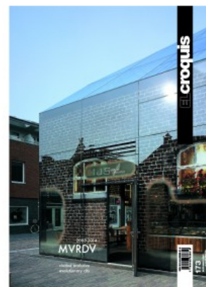
N.173 MVRDV 2003 - 2014. EVOLUTIONARY CITY