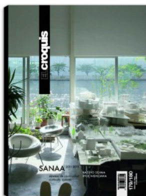
N.179/180 SANAA STUDIO: SEJIMA & NISHIZAWA 2011 - 2015