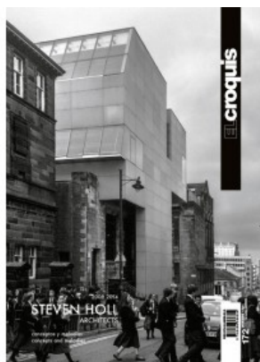
N.172 STEVEN HOLL ARCHITECTS 2008 - 2014 CONCEPT AND MELODIES