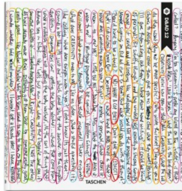
D&AD 2012 D&AD 9783836535175 39,99€