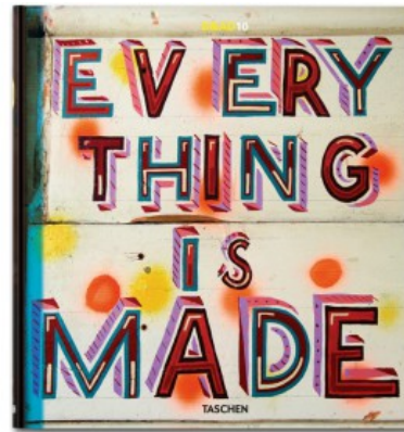
D&AD 2010 D&AD 9783836525008 39,99€