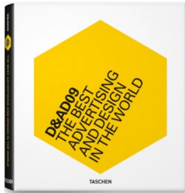
D&AD 2009 D&AD 9783836520843 39,99€