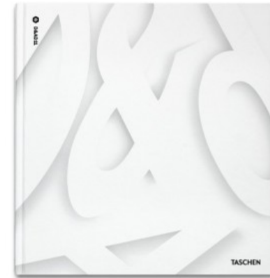
D&AD 2011 D&AD 9783836528849 39,99€