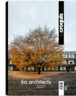
N.192 6A ARCHITECTS