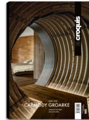
N.195 CARMODY GROARKE (2009-2018)