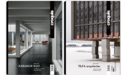
N.196 KARAMUK KUO - TED'A ARQUITECTES