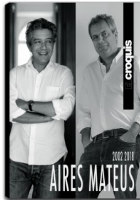
AIRES MATEUS 2002-2018