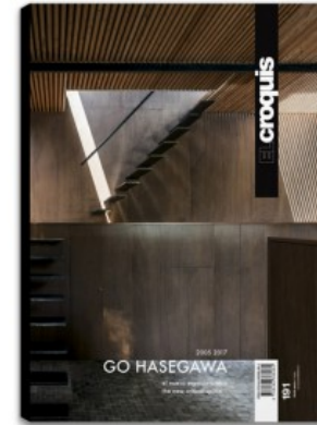
N.191 GO HASEGAWA