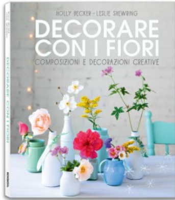
DECORARE CON I FIORI. COMPOSIZIONI E DECORAZIONI CREATIVE