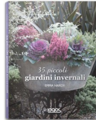
35 PICCOLI GIARDINI INVERNALI