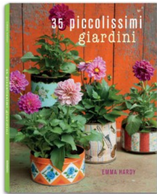
35 PICCOLISSIMI GIARDINI