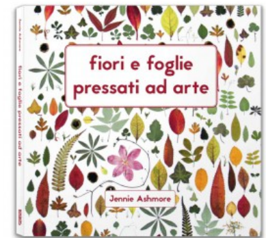
FIORI E FOGLIE PRESSATI AD ARTE