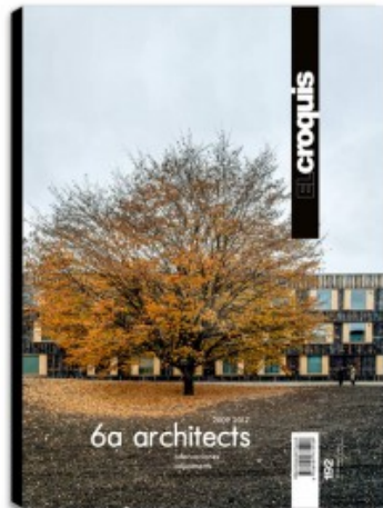
N.192 6A ARCHITECTS