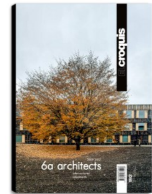
N.192 6A ARCHITECTS