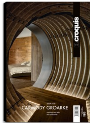
N.195 CARMODY GROARKE (2009-2018)