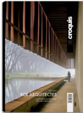
N.190 RCR ARCHITECTS 2012 - 2017