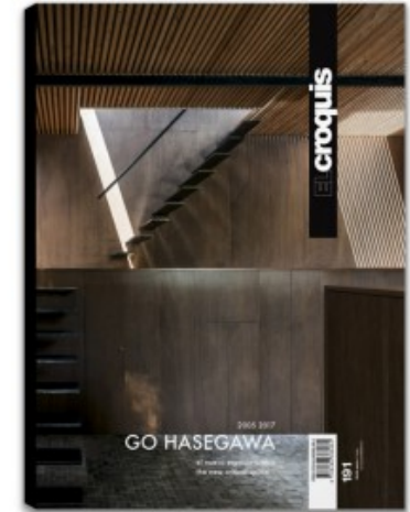
N.191 GO HASEGAWA