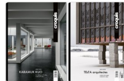
N.196 KARAMUK KUO - TED'A ARQUITECTES