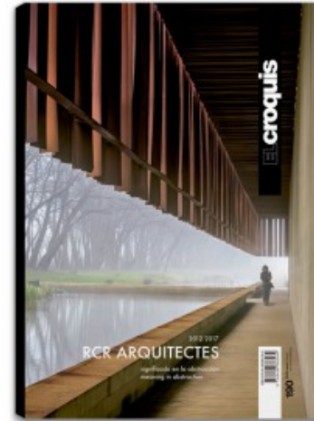
N.190 RCR ARCHITECTS 2012 - 2017