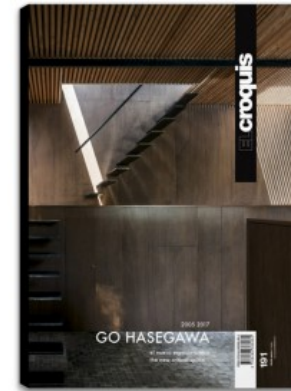
N.191 GO HASEGAWA