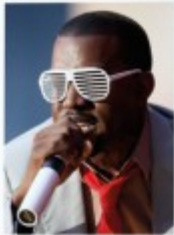
2009 Kanye West p.30