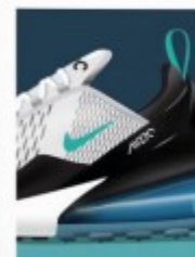
2018 Nike vs adidas p.50