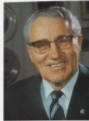
2005 adidas SS35 p.25