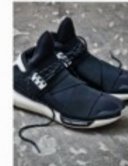
2014 Y-3 Qasa p.42