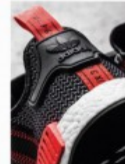
2013 adidas BOOST p.38