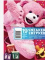
2006 Jeremy Scott x adidas p.27