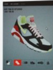
2004 NIKEiD p.22