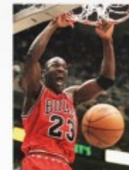
2008 Jordan Countdown p.29