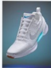
2016 Nike HyperAdapt 1.0 p.46