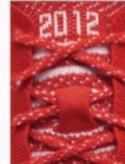
2012 Flyknit vs Primeknit p.36