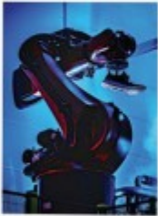
2015 adidas Futurecraft p.44