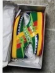
2010 Bapesta p.32