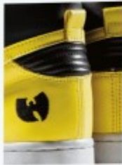
2002 Collaborations p.20