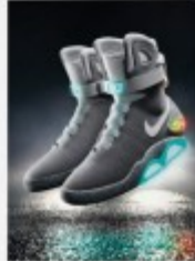
2011 Nike McFly p.34