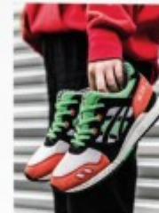
2007 Patta x ASICS p.28