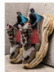
2018 The Dad Shoe p.52