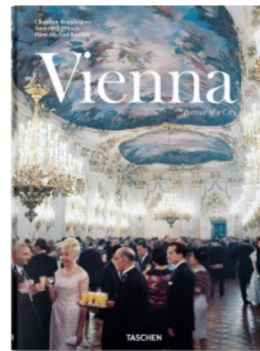
VIENNA. PORTRAIT OF A CITY

Marc Walter, Sabine Arqué 9783836578509 150,00€