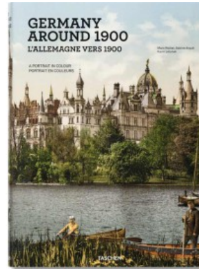
GERMANY AROUND 1900. A PORTRAIT IN COLOUR

Joan Blaeu, Peter Van der Krogt 9783822851074 29,99€