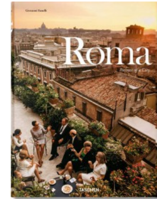
ROMA. PORTRAIT OF A CITY (I E GB)

Marc Walter, Sabine Arqué, Karin Lelonek 9783836549783 150,00€