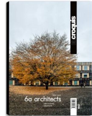
N.192 6A ARCHITECTS A.A.V.V. 9788494775406 64,00€