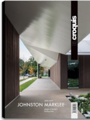
N.198 JOHNSTON MARKLEE (2005-2019)