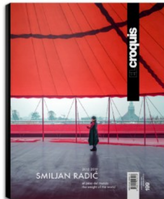
N.199 SMILJAN RADIC (2013-2019)