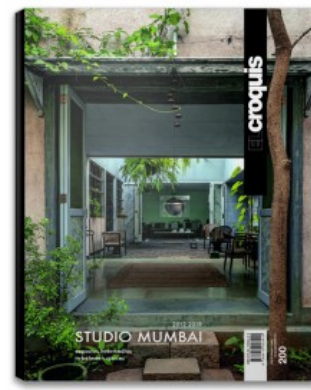
N.200 STUDIO MUMBAI (2012-2019)