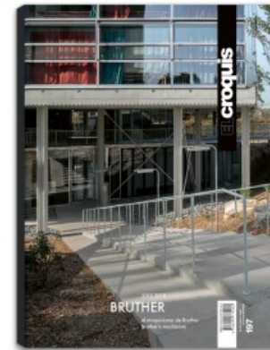
N.197 BRUTHER (2012-2018) AA.VV. 9788494775482 69,00€