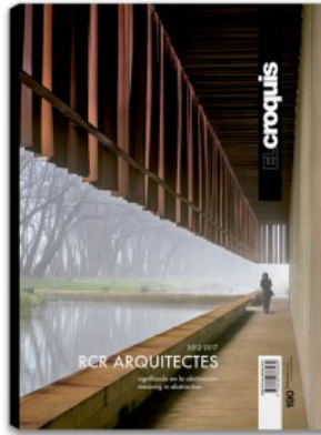
N.190 RCR ARCHITECTS 2012 - 2017 AA.VV. 9788488386960 78,00€