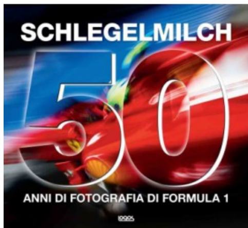
50 ANNI DI FOTOGRAFIA DI FORMULA 1

Rainer W. Schlegelmilch 9788857604671 59,95€