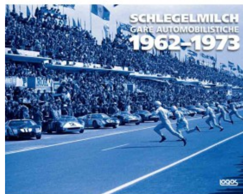
GARE AUTOMOBILISTICHE 1962-1973