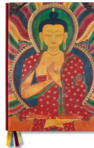
THOMAS LAIRD. MURALS OF TIBET - EDIZIONE LIMITATA

Philippe Garner, Reuel Golden 9783836524926 1.750,00€