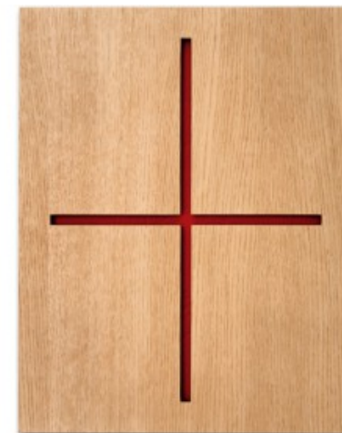
ANDO - ART EDITION

Rainer W. Schlegelmilch 9788857604664 29,95€