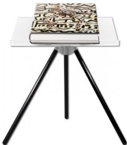
ANNIE LEIBOVITZ - ART EDITION