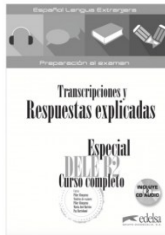
ESPECIAL DELE B2 CURSO COMPLETO - TRANSCRIPCIONES Y RESPUESTAS EXPLICADAS