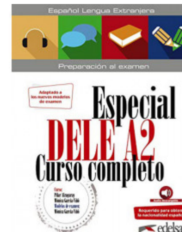
ESPECIAL DELE A2 CURSO COMPLETO. ED. 2020