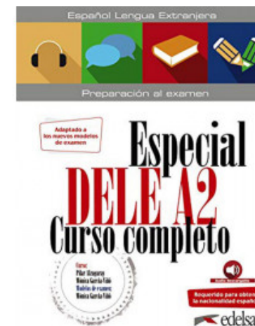
ESPECIAL DELE A2 CURSO COMPLETO. ED. 2020