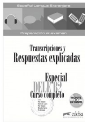
ESPECIAL DELE B2 CURSO COMPLETO - TRANSCRIPCIONES Y RESPUESTAS EXPLICADAS