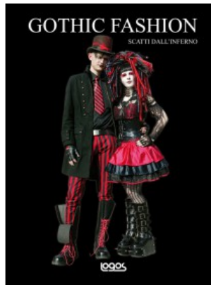
GOTHIC FASHION. SCATTI DALL'INFERNO