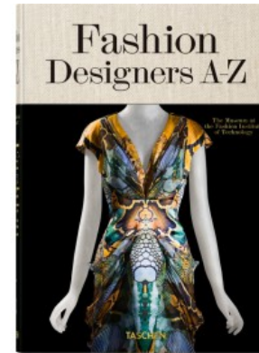
FASHION DESIGNERS A-Z

Valerie Steele, Suzy Menkes 9783836572507 30,00€