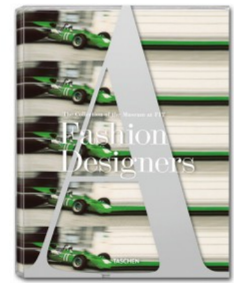
FASHION DESIGNERS A-Z, AKRIS EDITION

Alison A. Nieder, Jim Heimann 9783836514620 29,99€