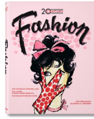
20TH CENTURY FASHION

Alison A. Nieder, Jim Heimann 9783836514620 29,99€