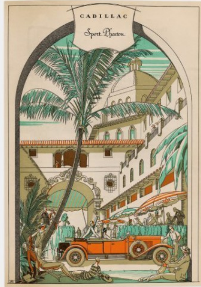
Apresento the Cadillac 1910-1911