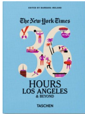
NYT. 36 HOURS. LOS ANGELES & BEYOND - POCKET SIZE