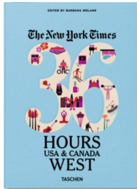
NYT. 36 HOURS. USA & CANADA. WEST COAST