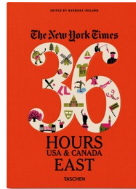
NYT. 36 HOURS. USA & CANADA. EAST COAST