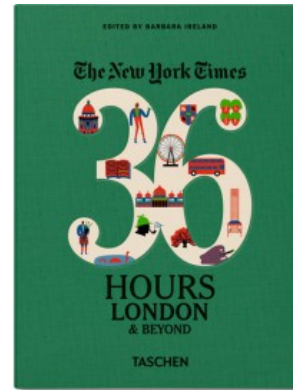
NYT. 36 HOURS. LONDON & BEYOND - POCKET SIZE