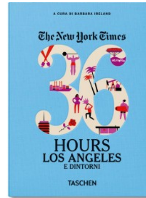
NYT. 36 HOURS. LOS ANGELES E DINTORNI - POCKET SIZE