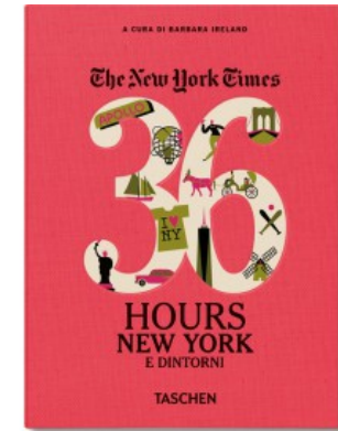
NYT. 36 HOURS. NEW YORK E DINTORNI - POCKET SIZE