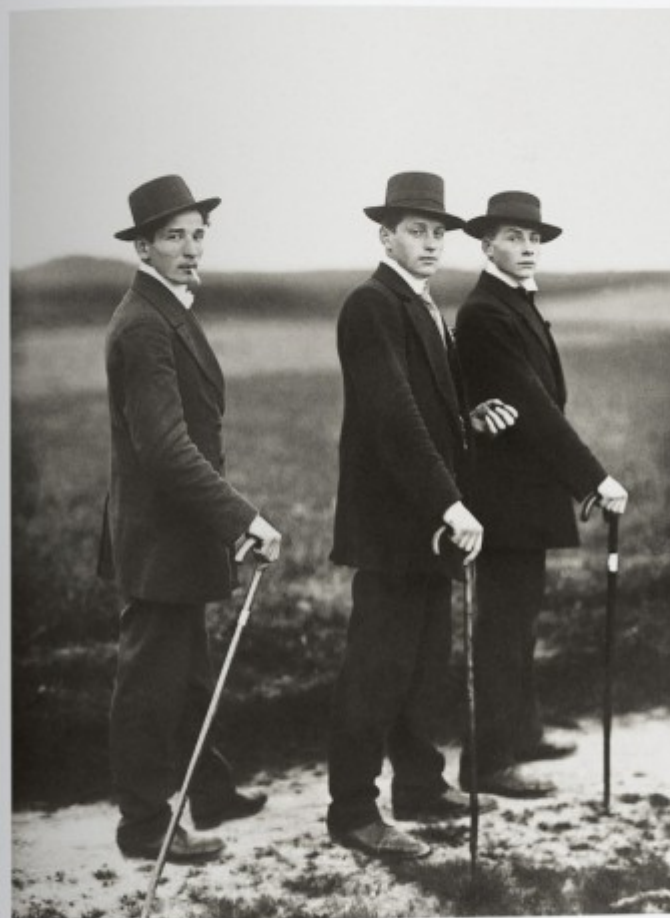
Young Farmers, 1914