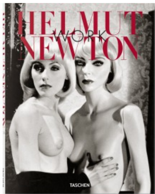
HELMUT NEWTON. WORK (IEP)

Reuel Golden, Lyle Rexer 9783836561457 450,00€