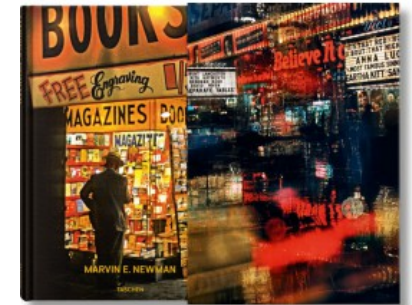
MARVIN E. NEWMAN - EDIZIONE LIMITATA

Helmut Newton, Philippe Garner 9783822835050 29,99€