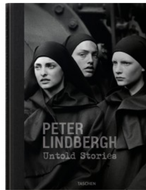
PETER LINDBERGH. UNTOLD STORIES