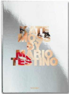
KATE MOSS BY MARIO TESTINO