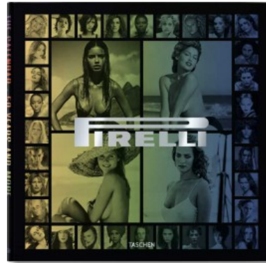
PIRELLI - THE CALENDAR. 50 YEARS AND MORE - TRADE EDITION