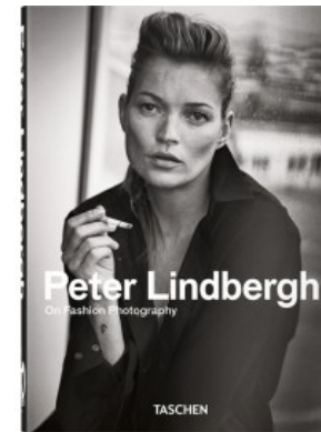
PETER LINDBERGH. ON FASHION PHOTOGRAPHY (I/E) - 40

Peter Lindbergh, Wim Wenders, Felix Krämer 9783836579919 60,00€