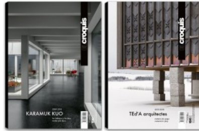
N.196 KARAMUK KUO - TED'A ARQUITECTES