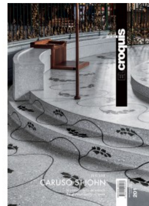
N.201 CARUSO ST JOHN (2013-2019)