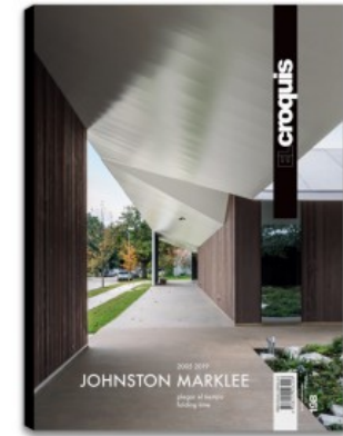
N.198 JOHNSTON MARKLEE (2005-2019)