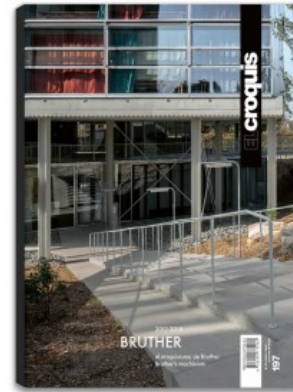
N.197 BRUTHER (2012-2018)