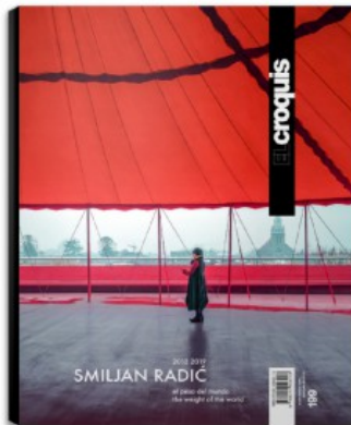
N.199 SMILJAN RADIC (2013-2019)