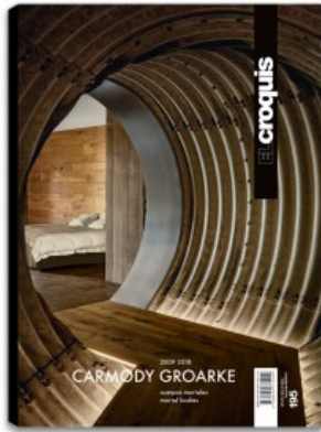
N.195 CARMODY GROARKE (2009-2018)