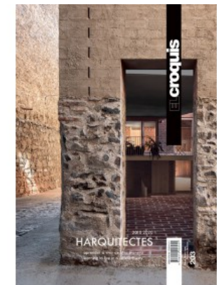
N.203 HARQUITECTES (2010-2020)