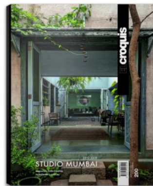
N.200 STUDIO MUMBAI (2012-2019)