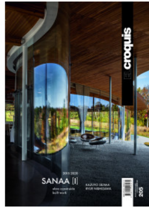
N.205 SANAA 2015-2020