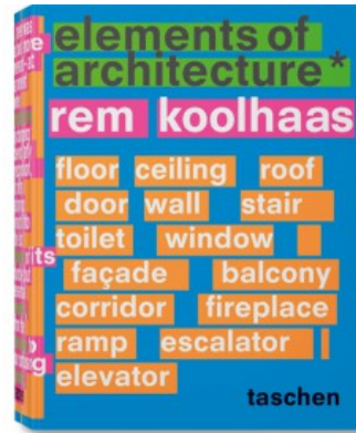
REM KOOLHAAS. ELEMENTS OF ARCHITECTURE Rem Koolhaas 9783836556149 100,00€