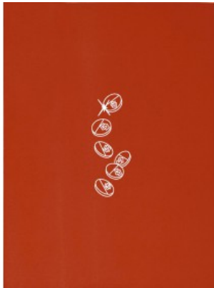
KOOLHAAS. GREAT LEAP FORWARD Rem Koolhaas 9783822860489 29,99€