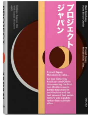
PROJECT JAPAN. METABOLISM TALKS Rem Koolhaas, Hans Ulrich Obrist 9783836525084 50,00€