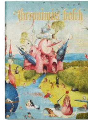
HIERONYMUS BOSCH. L'OPERA COMPLETA - EXTRA LARGE