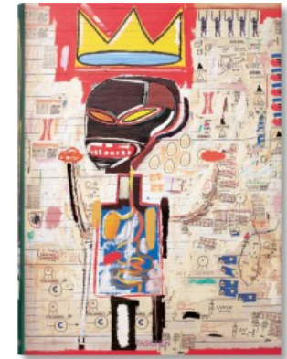
JEAN-MICHEL BASQUIAT - EXTRA LARGE