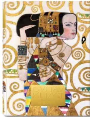
GUSTAV KLIMT. TUTTI I DIPINTI - EXTRA LARGE

Johannes Nathan, Frank Zöllner 9783822823187 150,00€