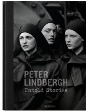
PETER LINDBERGH. UNTOLD STORIES