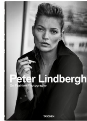
PETER LINDBERGH. ON FASHION PHOTOGRAPHY (INT) - EDIZIONE 2020