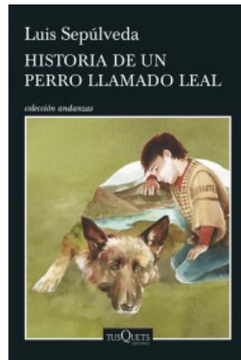
HISTORIA DE UN PERRO LLAMADO LEAL