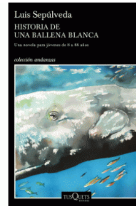
HISTORIA DE UNA BALLENA BLANCA