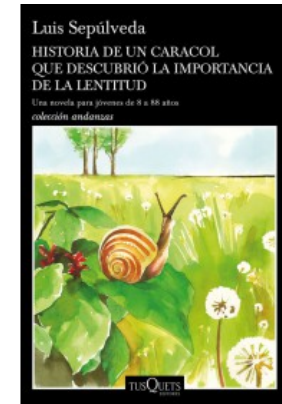
HISTORIA DE UN CARACOL QUE DESCUBRIÓ LA IMPORTANCIA DE LA LENTITUD