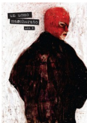
UN UOMO MASCHERATO