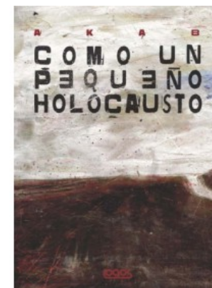
COMO UN PEQUENO HOLOCAUSTO