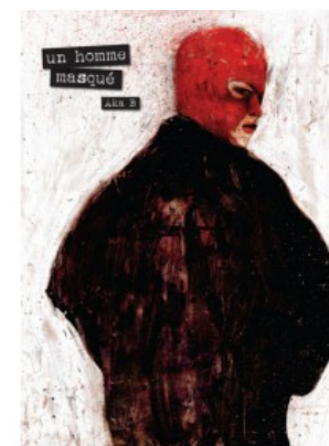
UN HOMME MASQUE