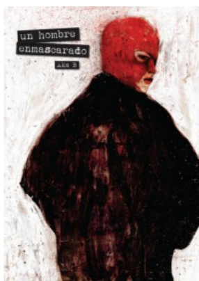
UN HOMBRE ENMASCARADO