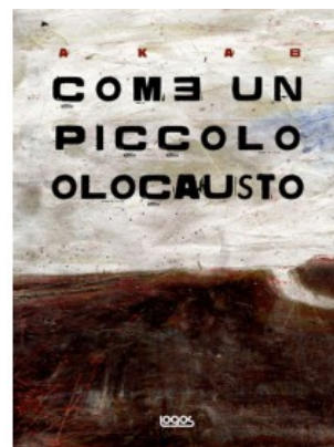
COME UN PICCOLO OLOCAUSTO