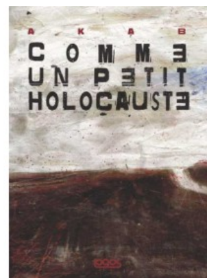
COMME UN PETIT HOLOCAUSTE