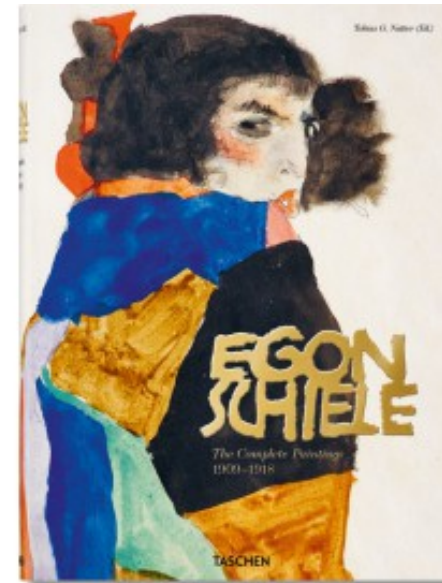
EGON SCHIELE. THE COMPLETE PAINTINGS 1909-1918