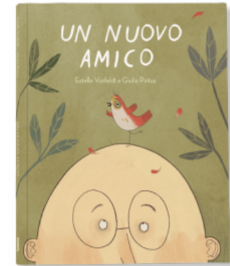
UN NUOVO AMICO

Graciela Beatriz Cabal 9788857610436 9,00€